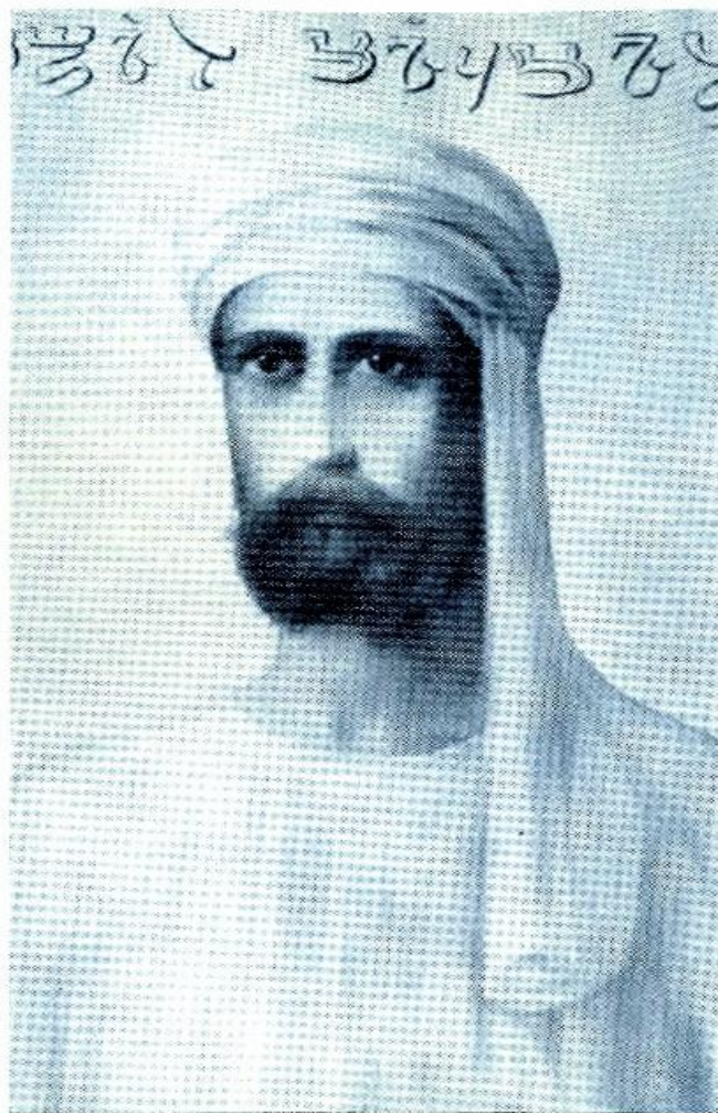
BELOVED EL MORYA CHOHAN OF THE FIRST RAY